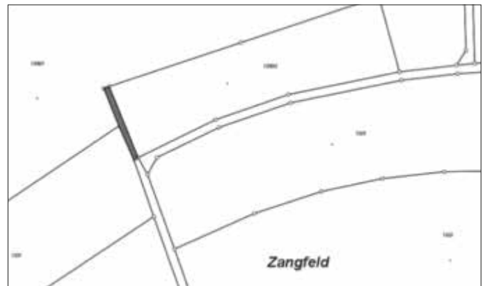
Lage zur beabsichtigten Einziehung eines Teils des Feldweges (Teilfläche von Flst. 1530/5)