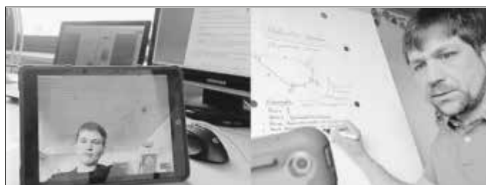
Jochen Streib erarbeitet mit Leonhard die Eigenschaften des Allgemeinen Vierecks.