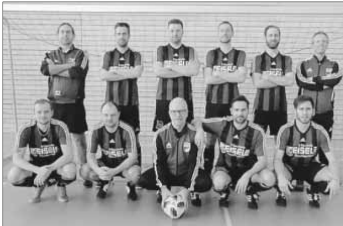
Ü42-Turniersieger TSV Essingen.