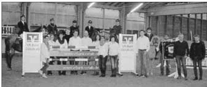
VR Bank-Sprung: Vielen Dank an die VR Bank Ostalb und im besonderen den Mitarbeitern der Geschäftsstelle in Essingen für den neuen Sprung. Dieser wurde am letzten Freitag dem Reitverein feierlich übergeben.