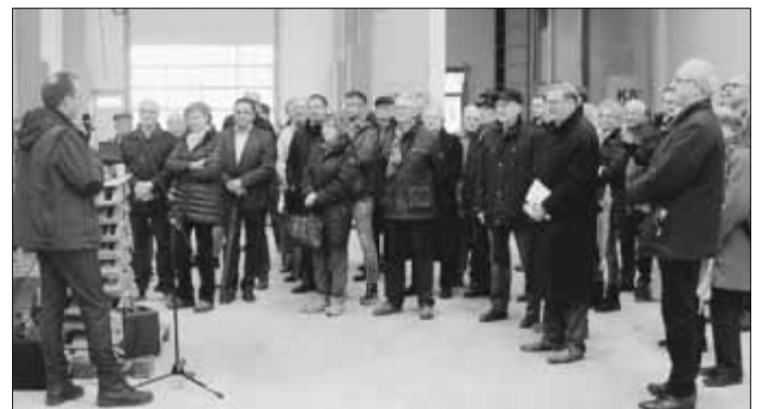
Reger Andrang bei der Besichtigung Go Ahead