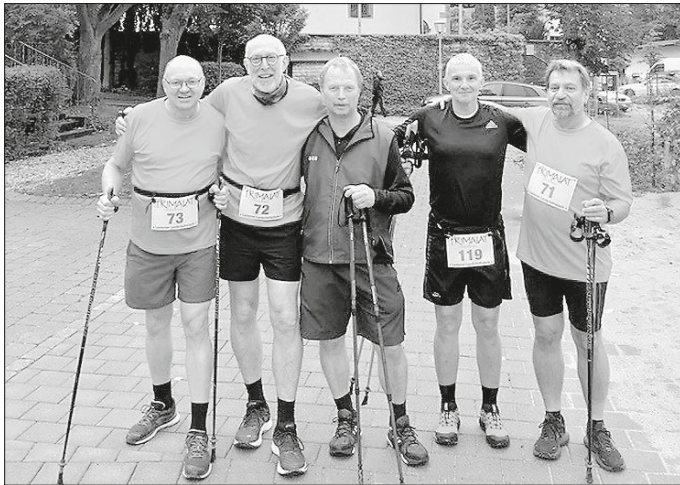
Die Jungs waren in diesem Jahr unter sich!

Ein großes Lob an das gesamte Organisationsteam vom SV Lautern. Von den Verpflegungsstationen der Zielverköstigung und den Siegerehrungen. Auch die Nordic Walker/innen wurden bedacht. Super!