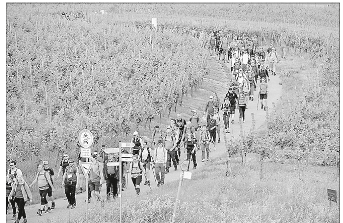
Bei besten Witterungsbedingungen marschierten die Wanderfreaks durch 9 Städte und Dörfer im unteren Remstal; hier im Bild am Kappelberg in Fellbach