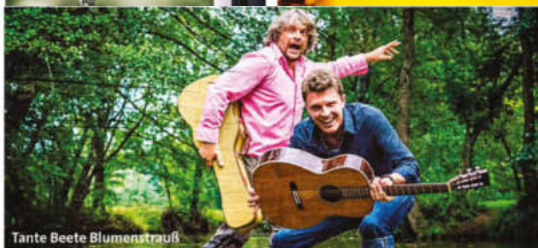
Tante Beete Blumenstrauß