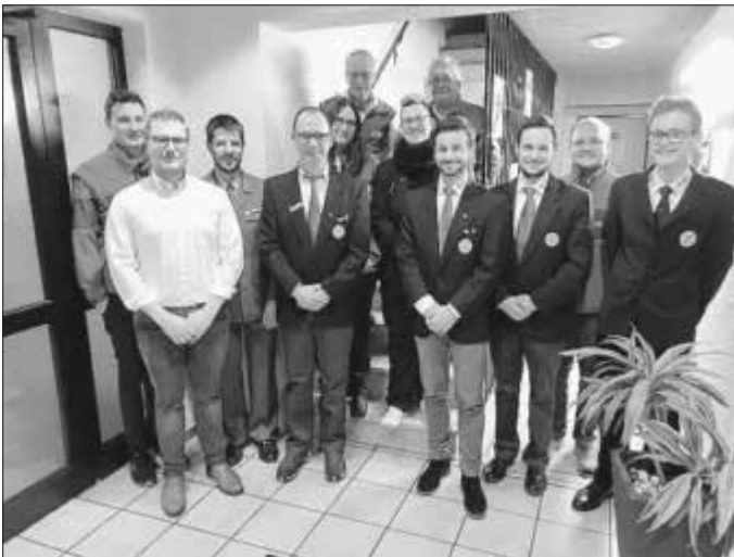
Der Leitungsausschuss des DRK Essingen