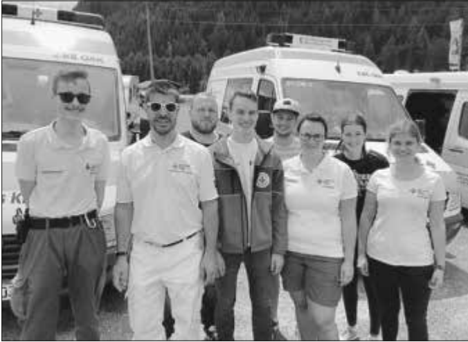
Einige Essinger Sanitäter auf dem Weg ins Südtiroler Martelltal im Juni 2019