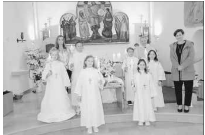
4. Oktober 2020 – 11.00 Uhr – 4. Gruppe

Unsere Erstkommunion wurde dieses Jahr festlich in unserer Gemeinde an zwei Tagen mit 23 Kindern, welche in vier Gruppen aufgeteilt waren, gefeiert. Die 23 Kinder durften an diesem besonderen Tag die „ Erste heilige Kommunion “ empfangen. Zusammen mit den Familien und Angehörigen konnten wir zwei wunderschöne Tage verbringen!