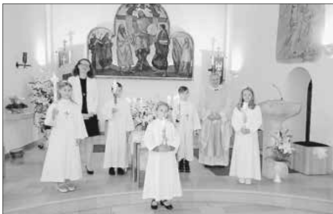
4. Oktober 2020 – 9.00 Uhr – 3. Gruppe