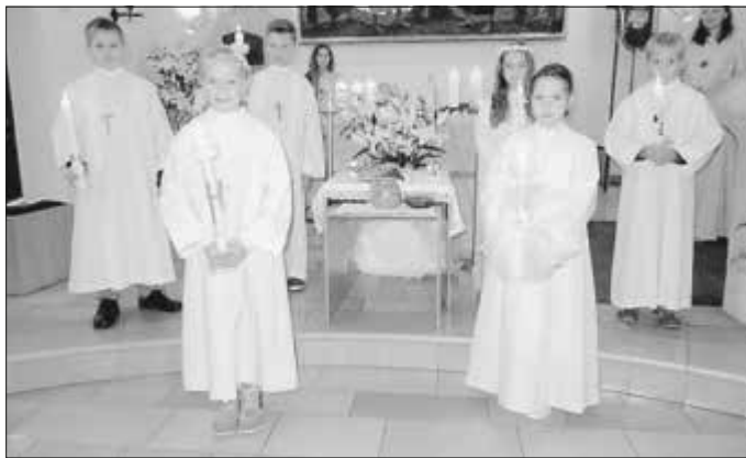
3. Oktober 2020 – 11.00 Uhr – 2. Gruppe