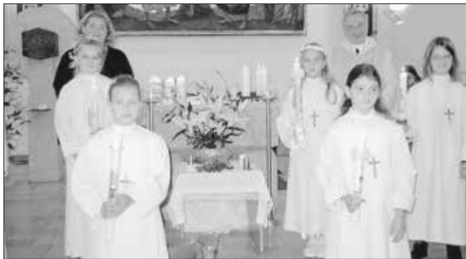
3. Oktober 2020 – 9.00 Uhr – 1. Gruppe