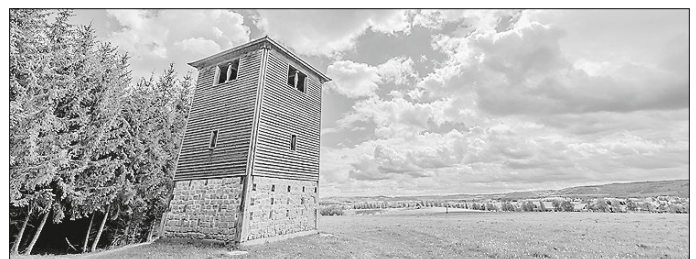
Der Limesturm bei Rainau