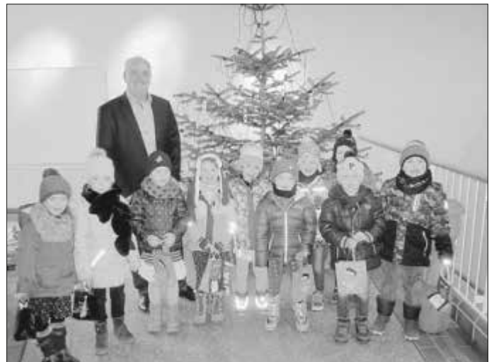
Kinder des Kinderhauses Rappelkiste schmückten dieses Jahr den Weihnachtsbaum im Rathaus