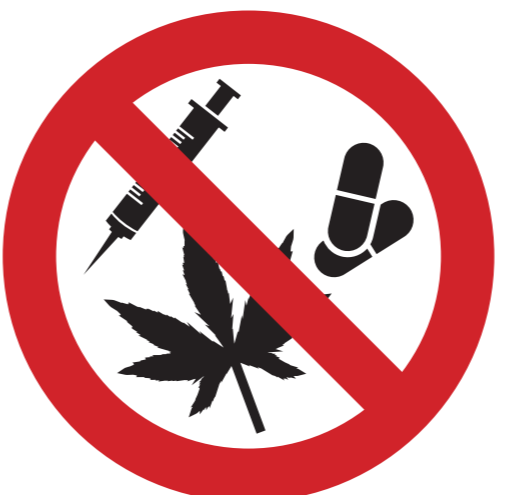
Drogen jeglicher Art