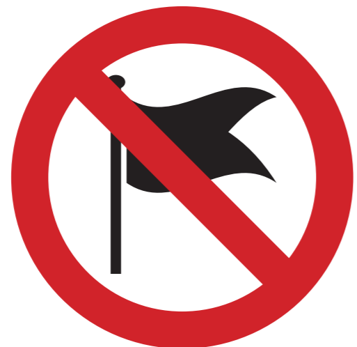
Fahnen- oder Transparentstangen länger als 1,5 m oder Ø größer 3 cm