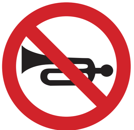
Lärminstrumente, wie Trötten und Trommeln