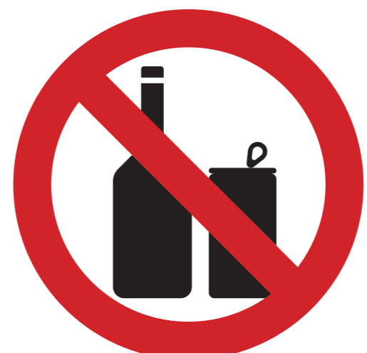
selbst mitgebrachte alkoholische Getränke