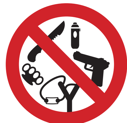
Waffen und Geschosse jeder Art