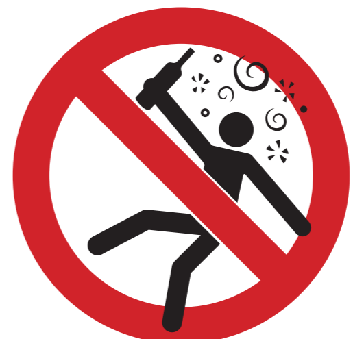
Zutritt/Aufenthalt unter erheblichem Alkohol- oder Drogeneinfluss