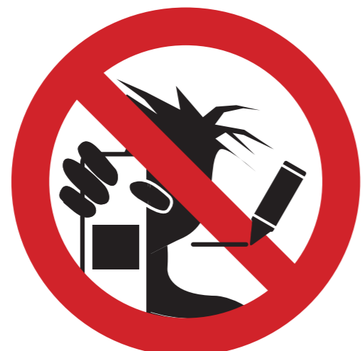
Beschriftungen, Aufkleber usw.