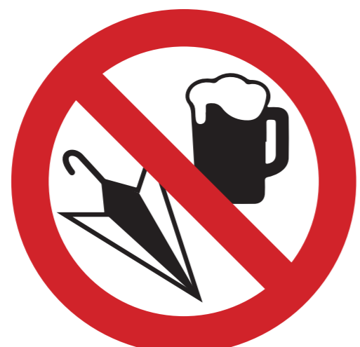
Sachen, die als Waffen oder Wurfgeschosse genutzt werden können