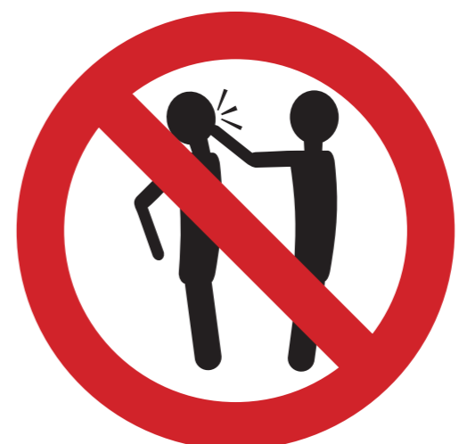
ungebührliches, gefährliches oder störendes Verhalten