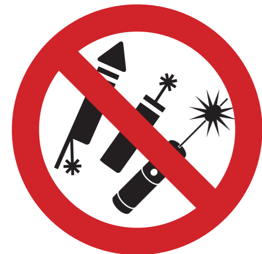
Feuerwerk, Pyrotechnik, Laser-Pointer usw.