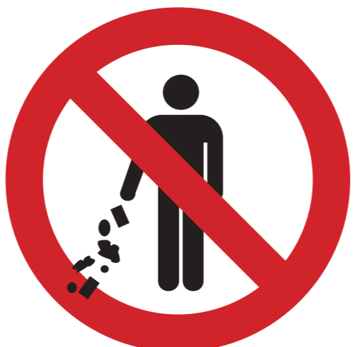
Verschmutzungen, Verunreinigungen usw.