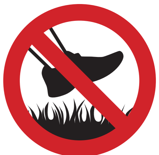
Spielfeld usw. nicht betreten